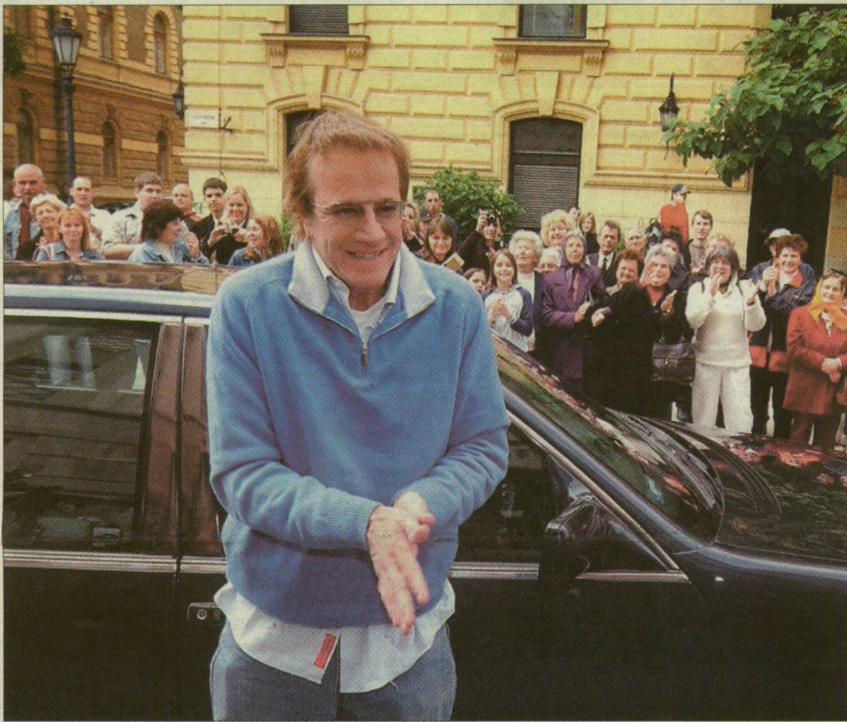
Világstár érkezik a Belvárosi moziba – Christopher Lambertet rajongók hada várta