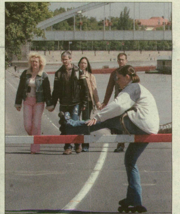
A szegedi rakparton már csak gyalogosan és görkorival lehet közlekedni