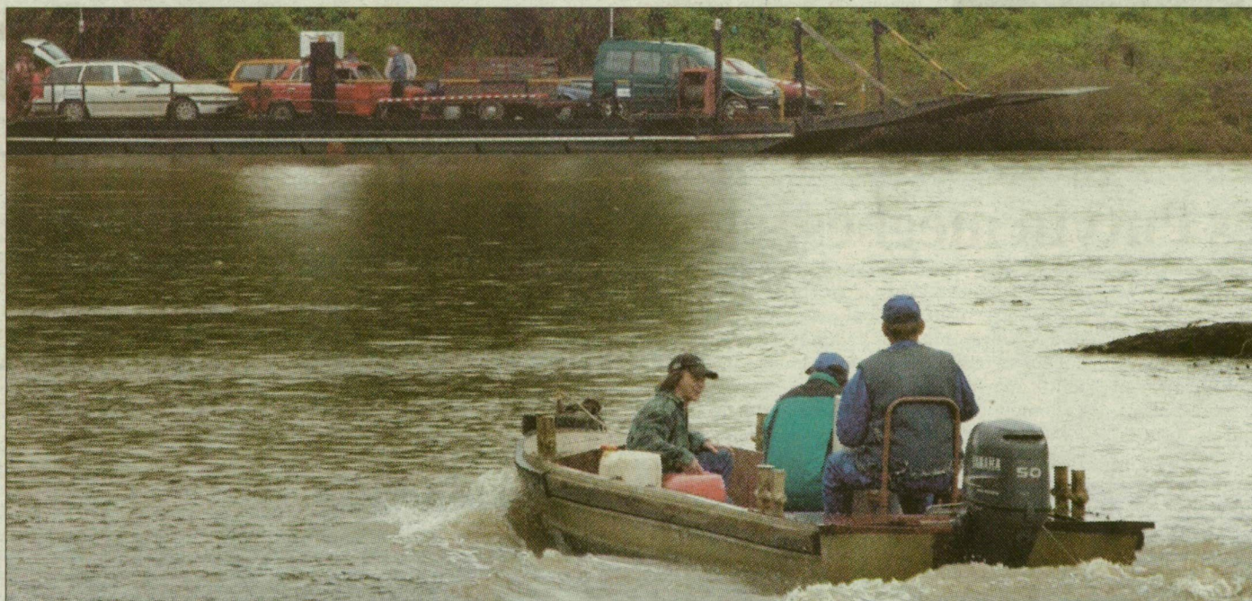
A sodródó kompból csak egy óra elteltével szállhattak ki az utasok a baksi oldalon