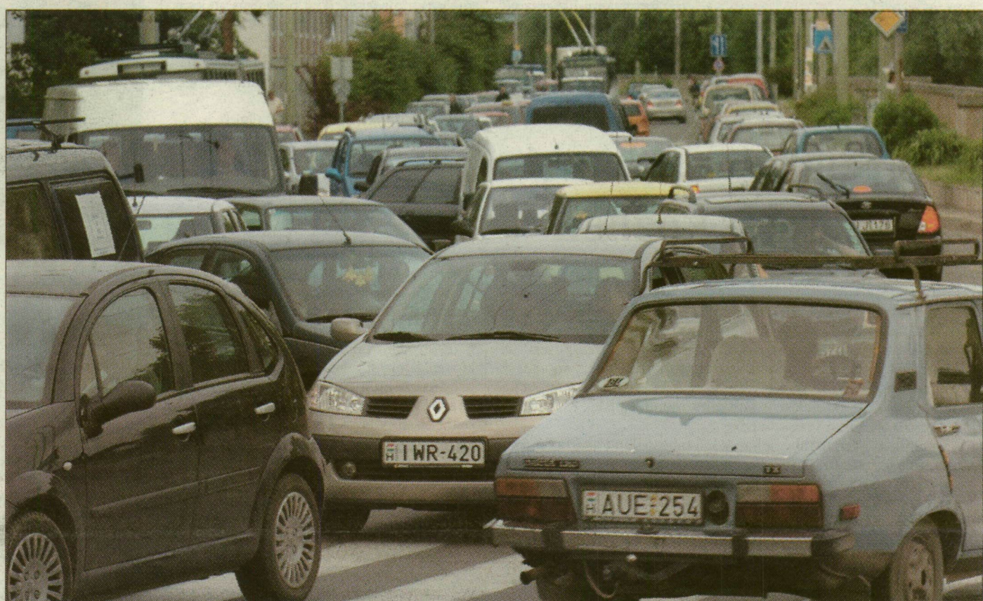
A felső Tisza-parton csak araszoltak az autók és a trolibuszok a délutáni csúcsban