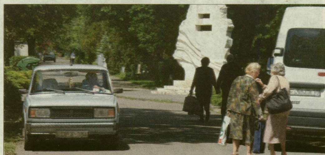
Azt szeretnék, ha csak az hajtana be autójával, aki erre rászorul