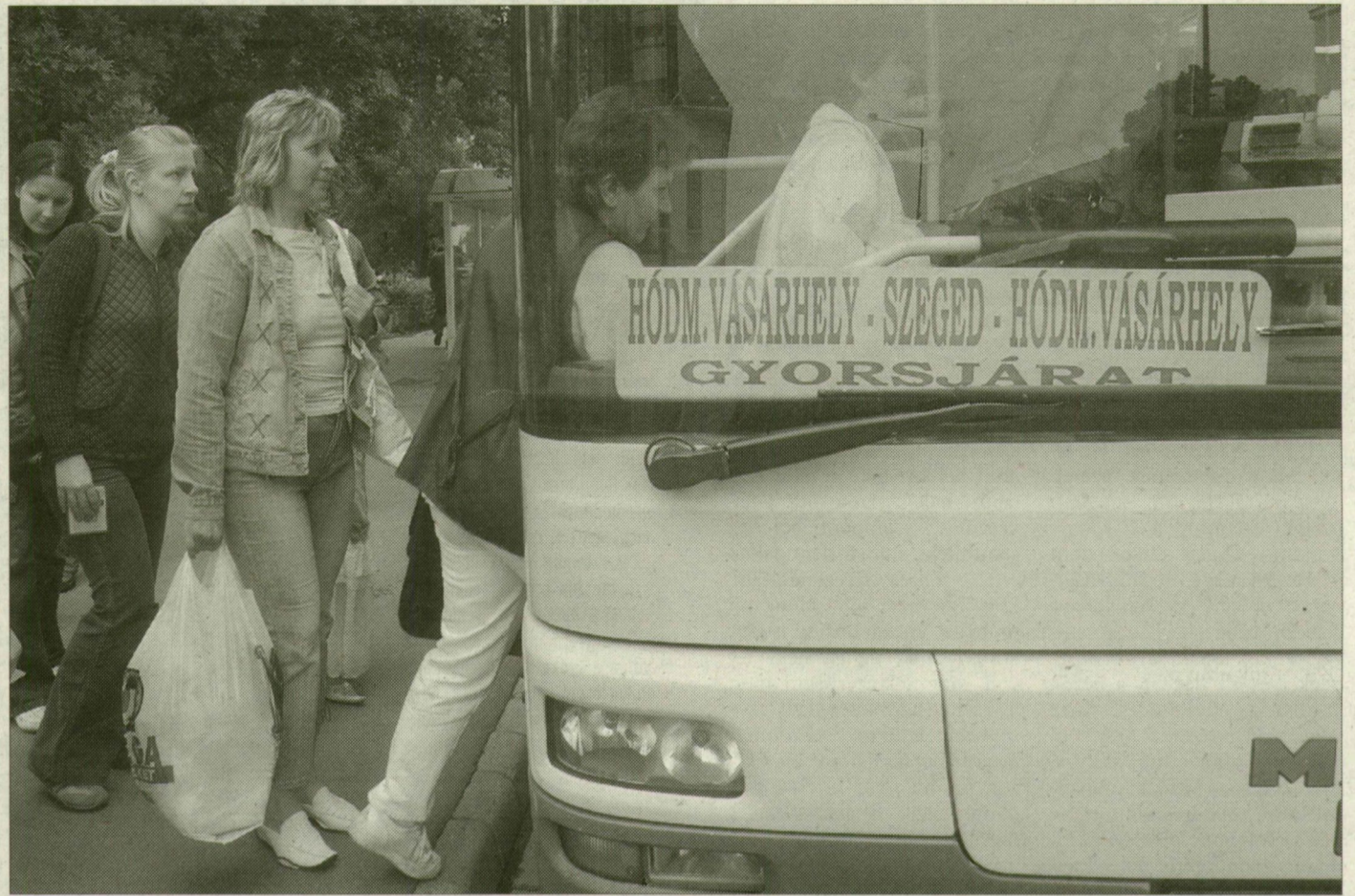
Átlagos délelőtt a vásárhelyi Kossuth téren. A Hód-Mező buszára legalább húszan szállnak