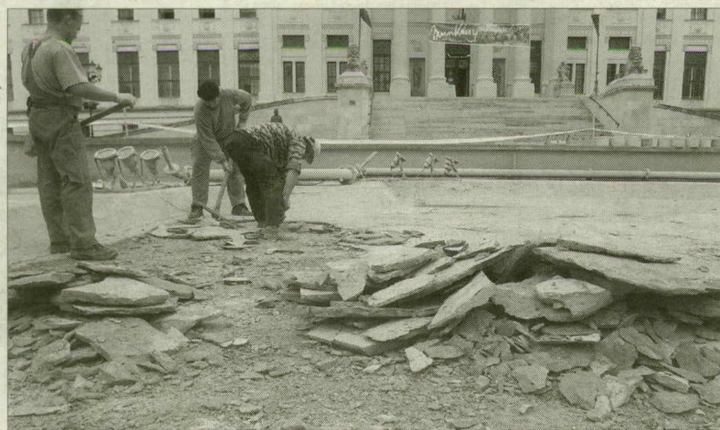
A hosszú árvíz felerősítette a talajmozgást, a medence alja is tönkrement