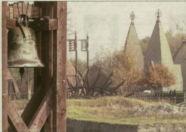
Élménypark is az emlékpark