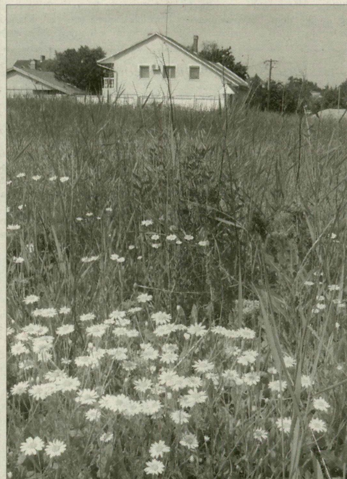
A terület kapós lehetne. Erre terjeszkedhet a város