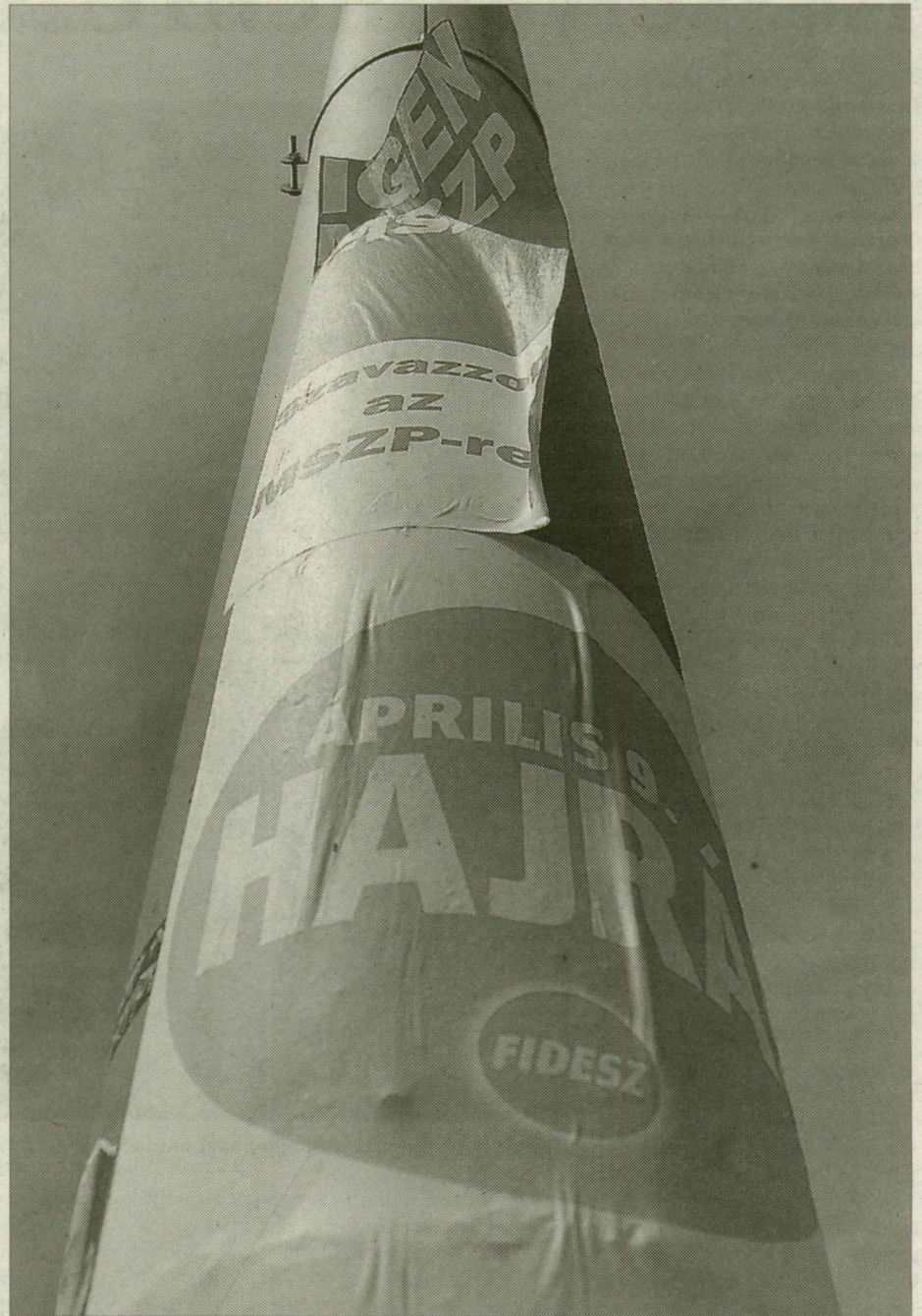
Lassabban haladnak, mint remélték a plakátok eltüntetését vállalók

■ Az önkormányzati választások kampányában érdemes lehet átvenni a hőmezővászárhelyi példát. Ott furnérlemezekre kasírozták a plakátokat, így a második forduló után csak a feldrótozott, csavarozott lemezeket kellett eltávolítani.