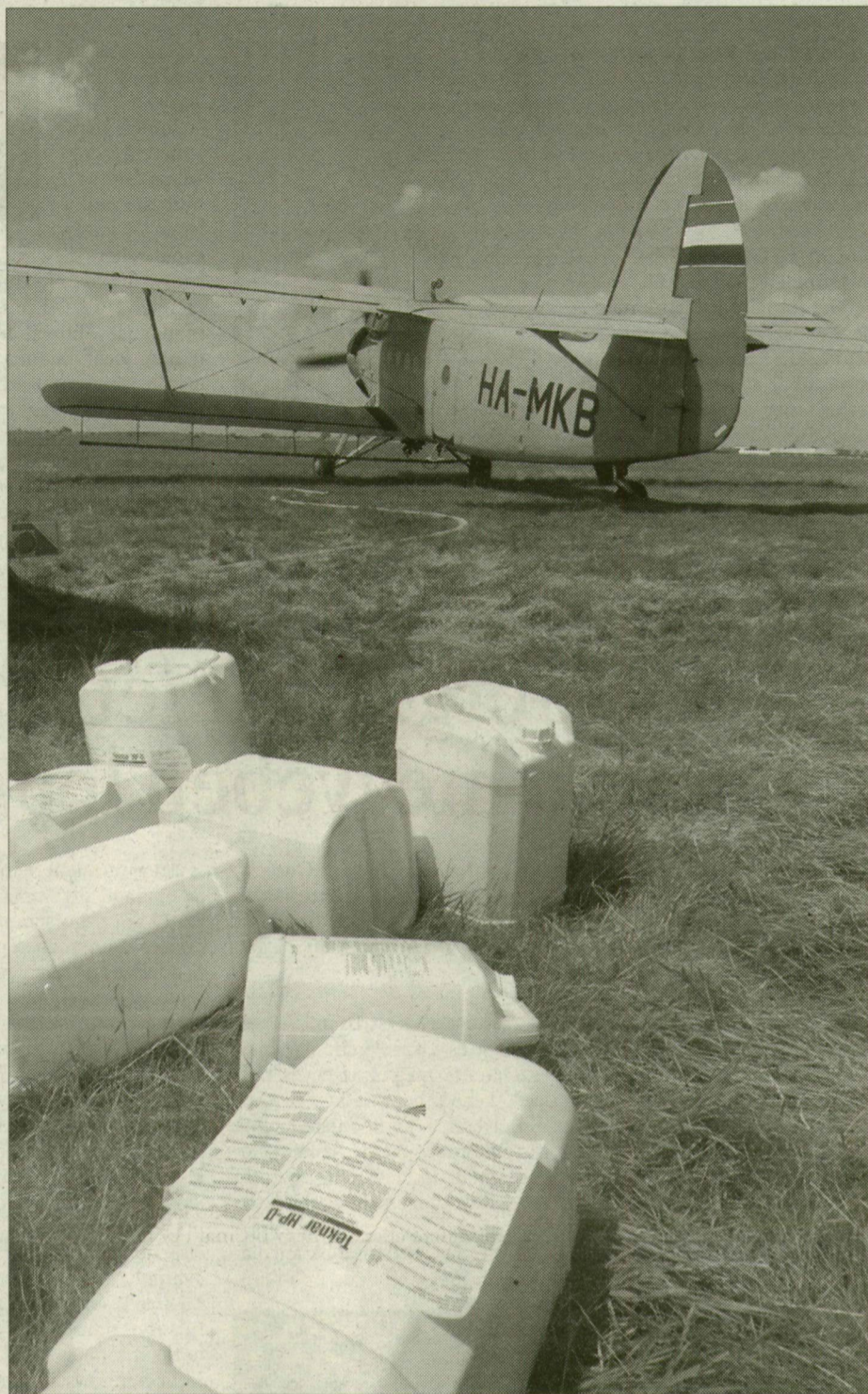
A permetezőgépek folyamatosan dolgoztak