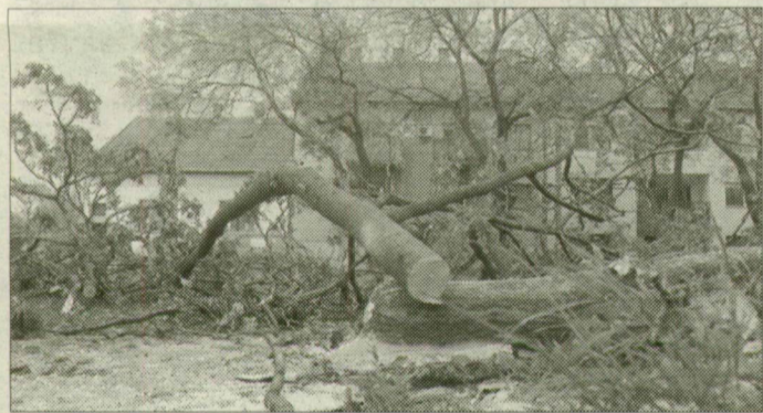
Minden kivágott fát sajnálunk