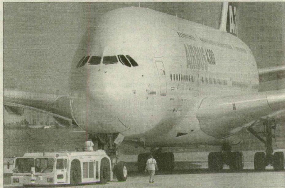
Parkolóhelyére gördül az Airbus A380-as gép a toulouse-i reptéren

A BAA, amely tavaly decemberben 1,3 milliárd fontért 75 százalékos mínusz egy részvény részesedést és 75 éves üzemeltetési jogot vásárolt a Ferihegyet működtető Budapest Airportban, a Heathrow kifutópályáit is újjaszfaltozta, va-