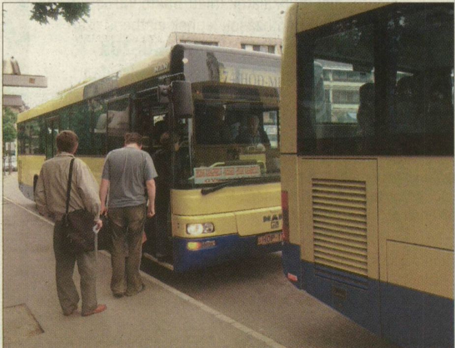
A Hód-Mező járműve Vásárhelyen. A sárga busz az önállóság és a vállalkozó kedv szimbólumává vált a kilencvenes években