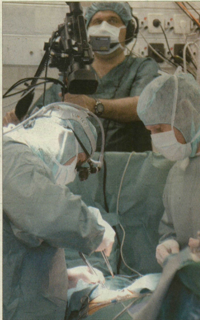
Dolgozik az operatőr és a mütős csapat