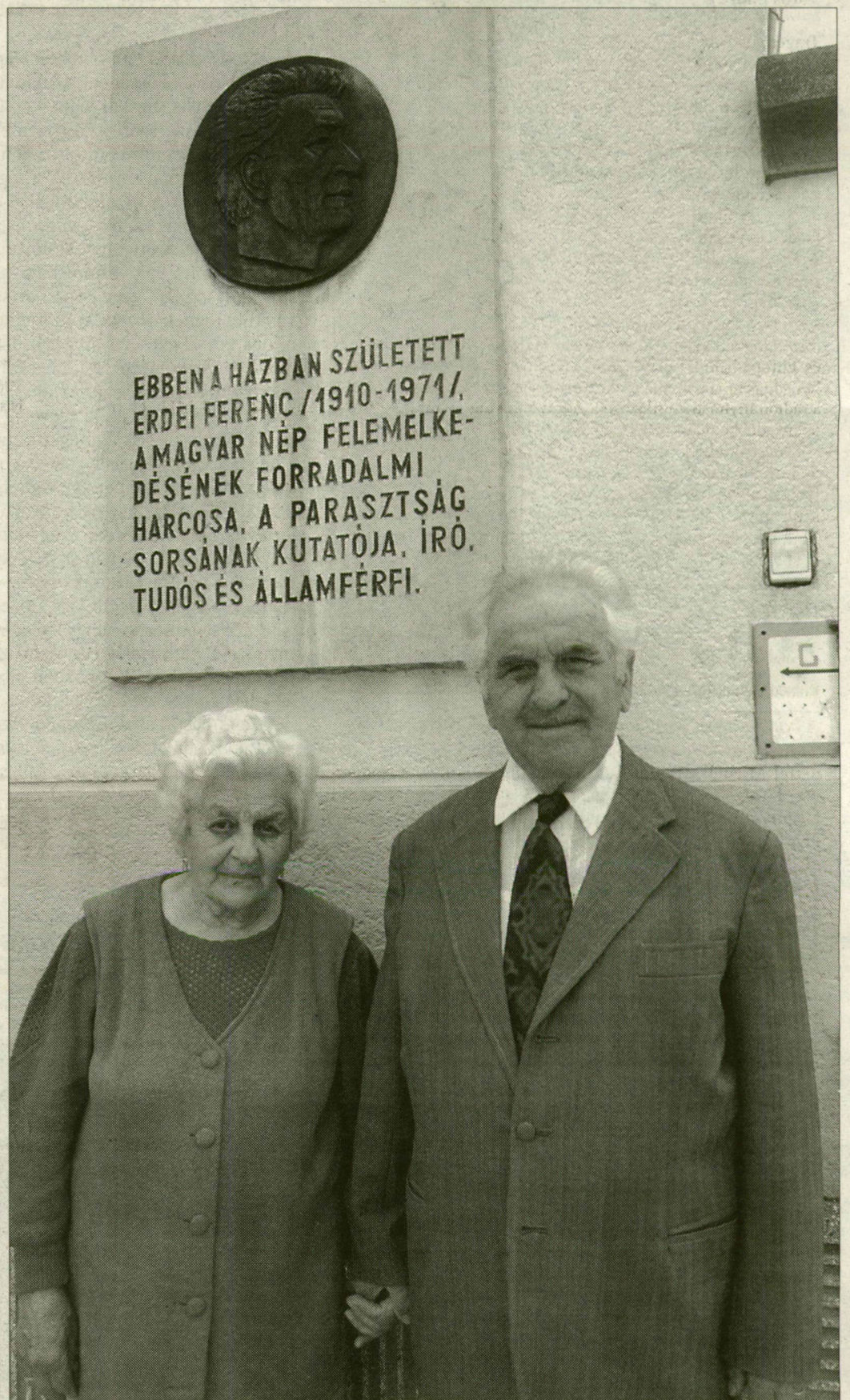
Szabóék a szülői háznál, mely az otthonuk

Utójára 1970-ben vágtak közösen disznót. Arra, hogy az egészségével valami baj lehet, ebédkor derült fény. A pörkölt elfogyasztása után Erdei rosszul