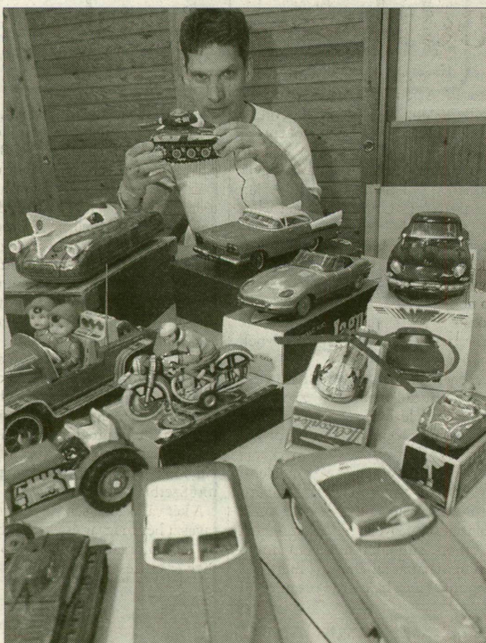
„Nem vadulok, ha valamit látok, elteszem”