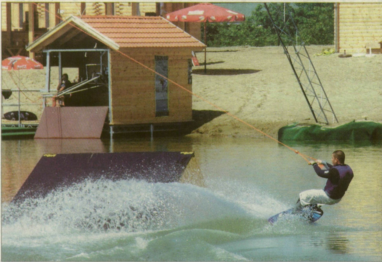
Egy kötéllel húzzák a vállalkozó szelleműt a tavon