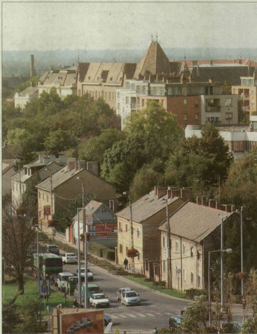
Hódmezővásárhelyi látkép. A város a jövőben profitál abból, hogy közel kerül a sztrádához