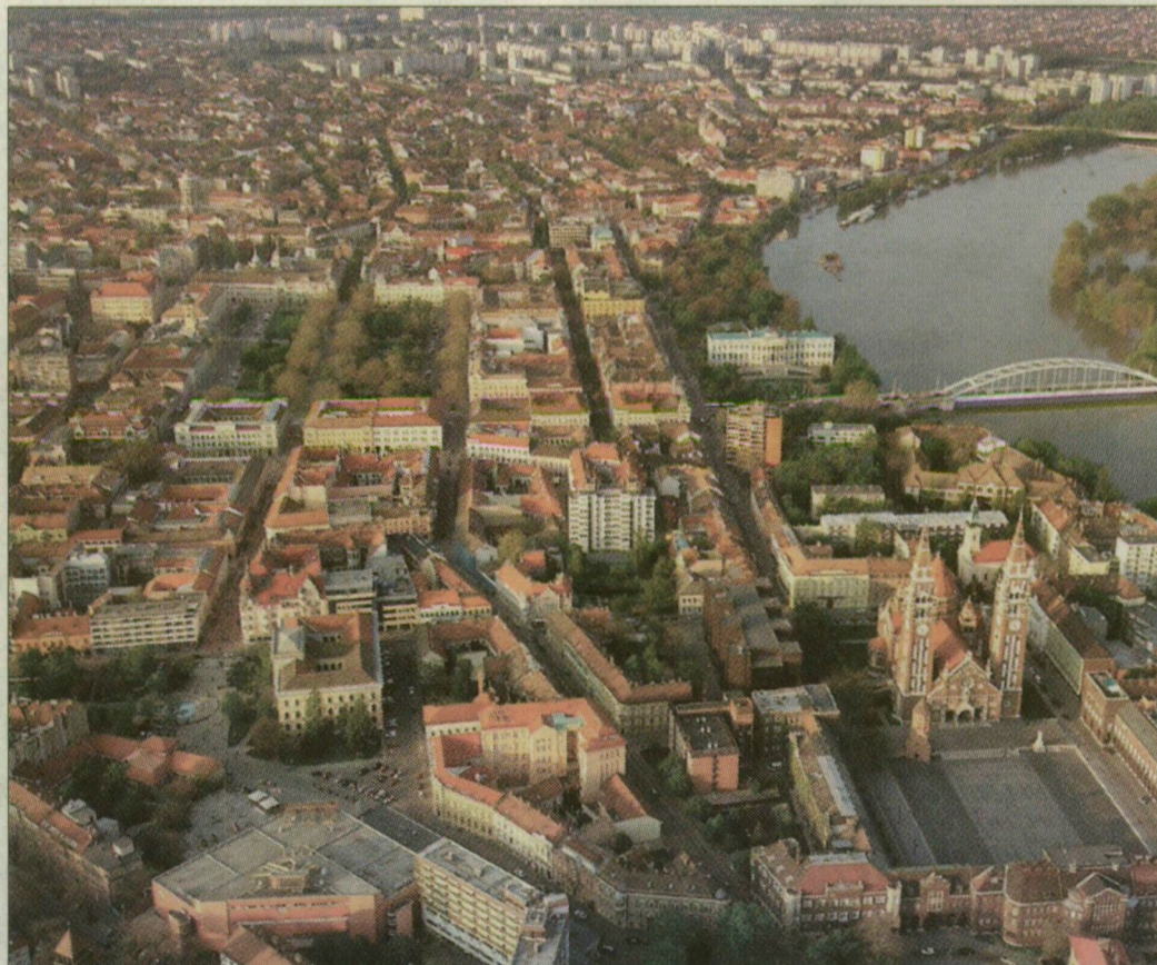
Szeged a régió központjaként csakúgy húzóereje lehetne a környezet fejlődésének, mint közlekedési csomópontként vagy logisztikai, illetve tudományos központként