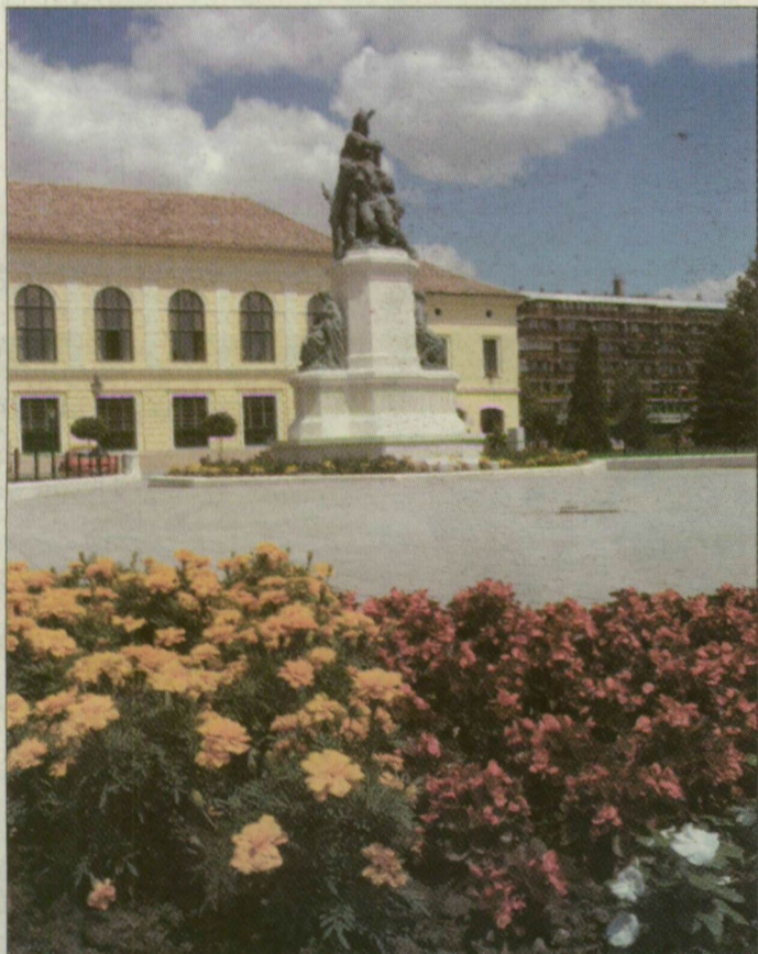
Makónak is profitálnia kell a Szeged régióközponti szerepéből adódó lehetőségekből