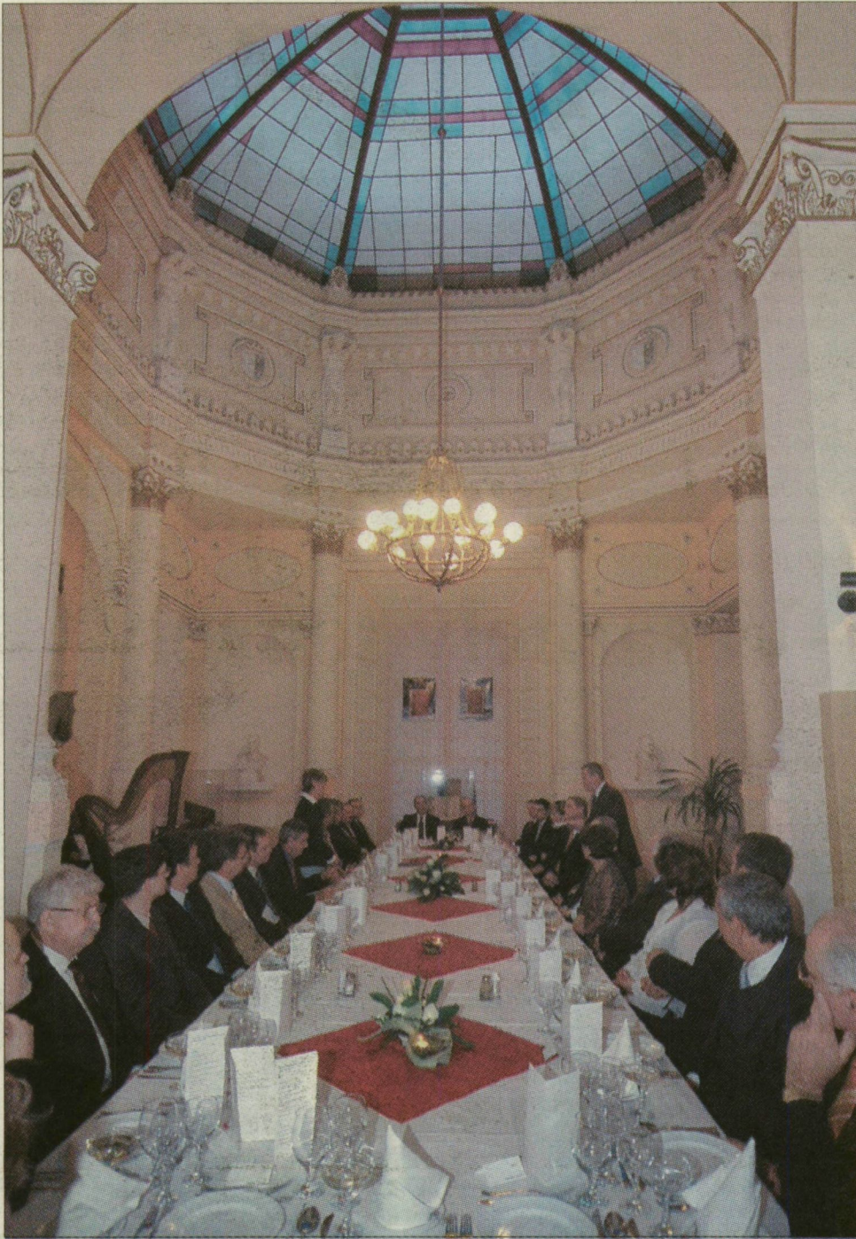
Különleges alkalom, különleges helyszín. A Móra Ferenc Múzeumba hívtuk vacsoravendégeinket

A ünnepek sora ma a Szabadkai úti épület hivatalos avatásával folytatódik, ahová várjuk Szili Katalint, az Országgyűlés elnökét, és Lord Rothermere-t, a DMGT elnökét.