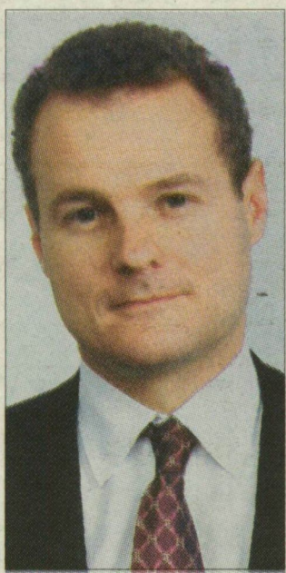
Lord Rothermere