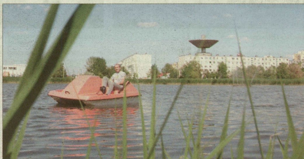
Néhány napja már vízbiciklizni is lehet a Búvár-tavon