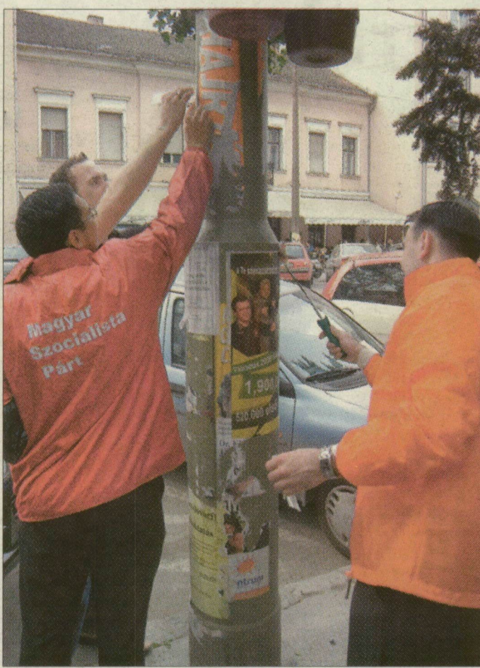
A pártok fiatal aktivistái együtt dolgoznak a plakátok eltávolításán

Addigra már heten voltunk – négyen a Fidelitástól, ketten a Fiatal Baloldaltól, plusz a munkára