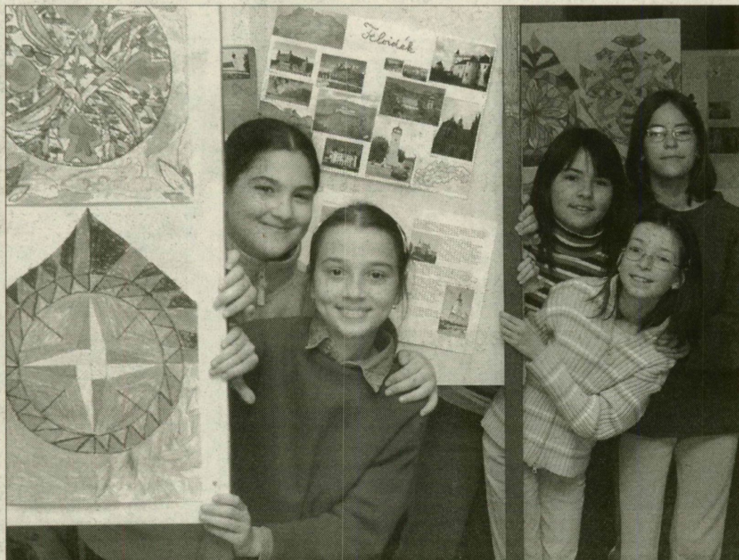
A díjnyertes diákok boldogok, hogy utazhatnak