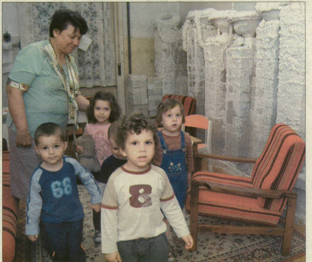
A Tisza-parti óvodában a csoportfoglalkozások egy részét sószobában tartják