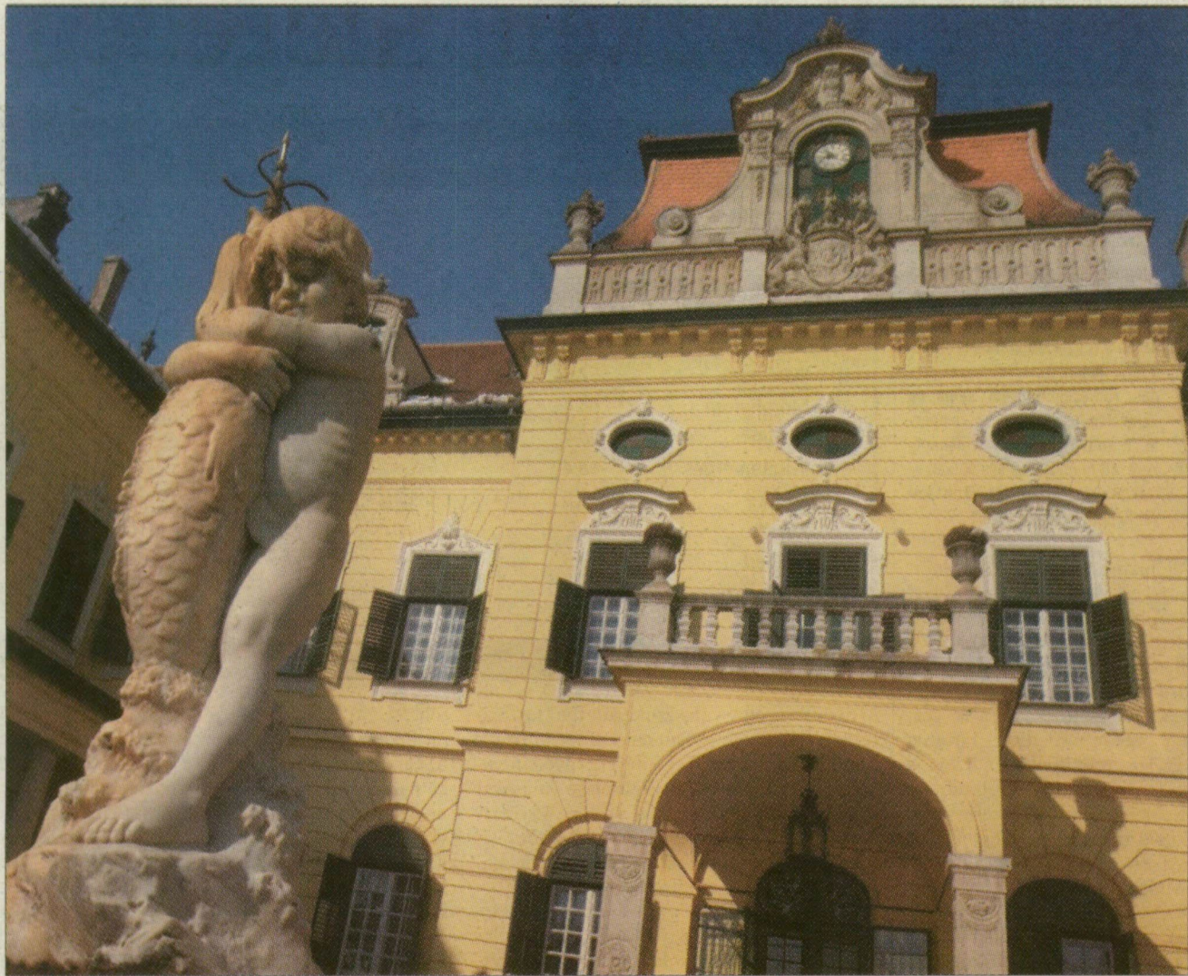
A nagymágocsi kastélyból elegáns szálloda lesz?