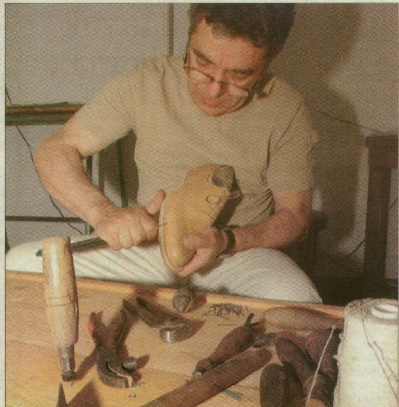
Nagy türelem és kézügyesség kell a cipőkészítéshez

Közel 1500 szavazat érkezett 250 fajta bora – fehér- és vörösborkat kategóriában. Az Év bora Szeged 2006 ünnepélyes eredményhirdetése, díjátadó gálája ma este háromnegyed 6-kor kezdődik az ifjúsági házban, ahol neves borászok jelenlétében osztják ki a Votre Santé-díjakat. A rendezvény fődíjaként – az Év-járát Szoba elnevezésű exkluzív étterem jóvoltából – kisorsolnak egy 200 ezer forint értékű, 16 személyes borvacsorát a meghívottak között.