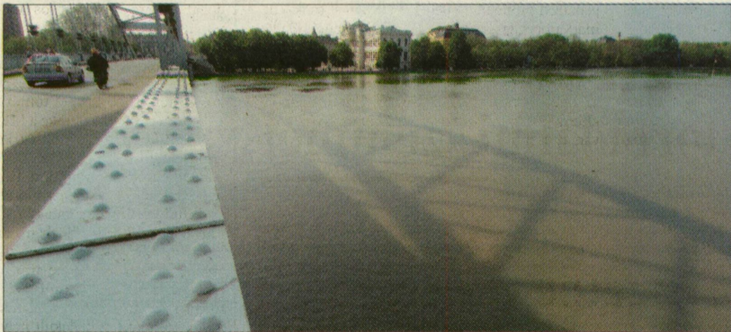
Lassan csökken a folyó vízszintje