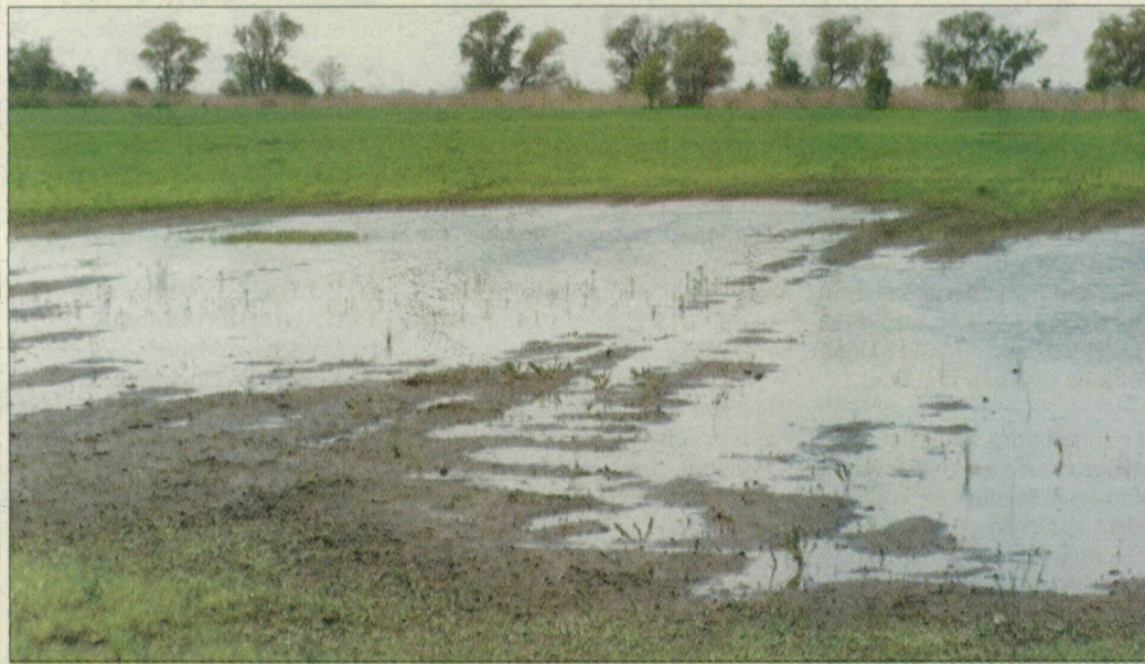
A belvíz miatt több ezer hektárt kénytelenek lesznek parlagon hagyni