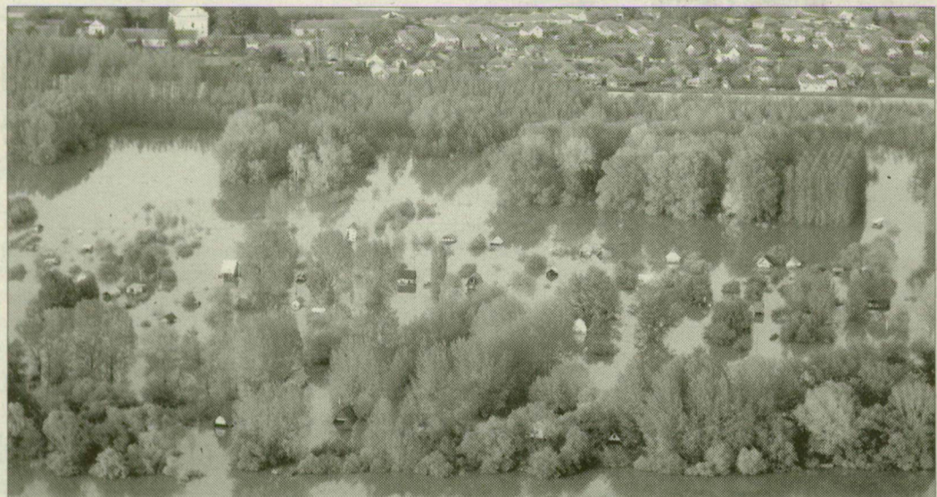
Szúnyognézőpontból nem rosszak a kilátások Szegeden