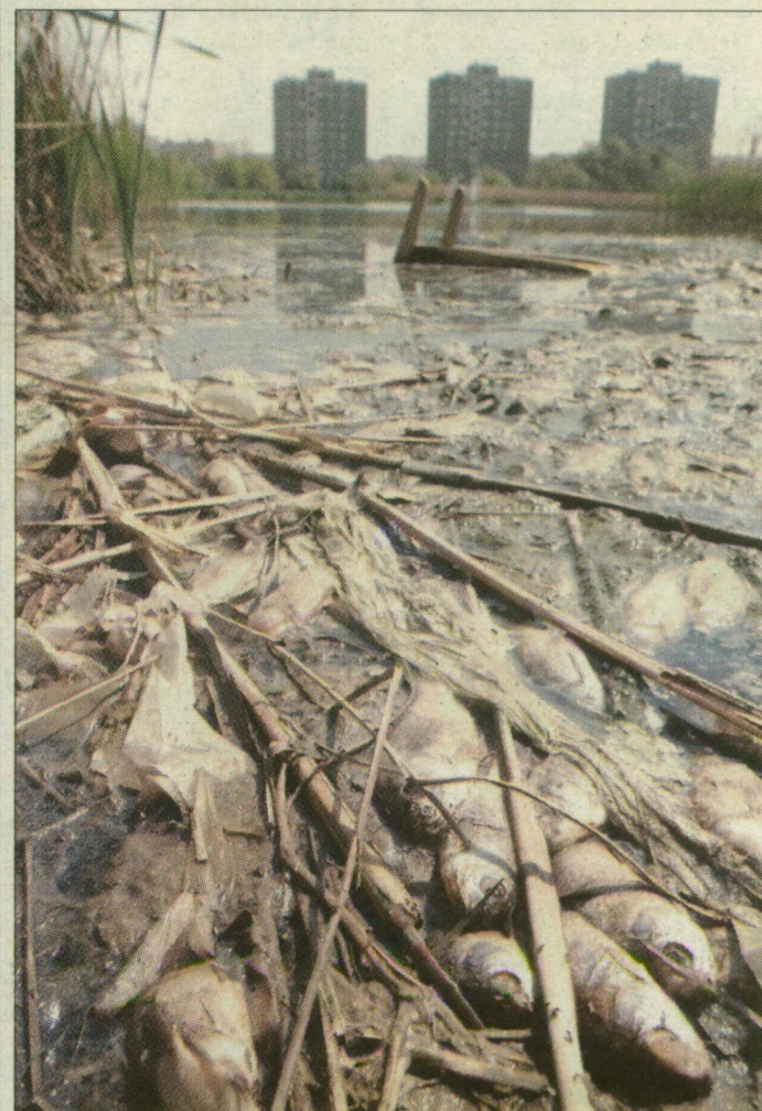
Víztükör által homályosan: döglött hal, hínár, szemet a pláza melletti Búvár-tóban

A szabadkai kisfiú kezelése még több mint tízmillió forintba kerül