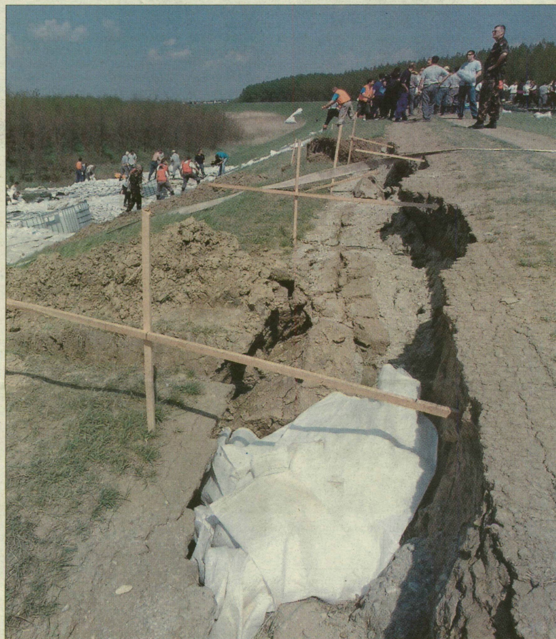
Földrengésre emlékeztető repedések a Hármaskörös gátján – óránként egy centit mozog a töltés

Kritikus a helyzet a Hármaskörösön, ahol heroikus küzdelem folyik a megrepedt gátszakaszokon, a tiszazugi települések közül Szelevény a legveszélyeztetettebb. Gátszakadástól lehet tartani. Az apadás még mindig nagyon lassú. Szegeden 10 méteres a vízállás.