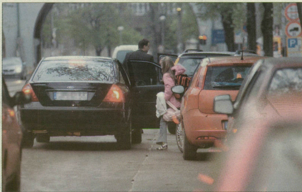
A Boldogasszony sugárúton tegnap is torlódtak az autók iskolakezdekskor