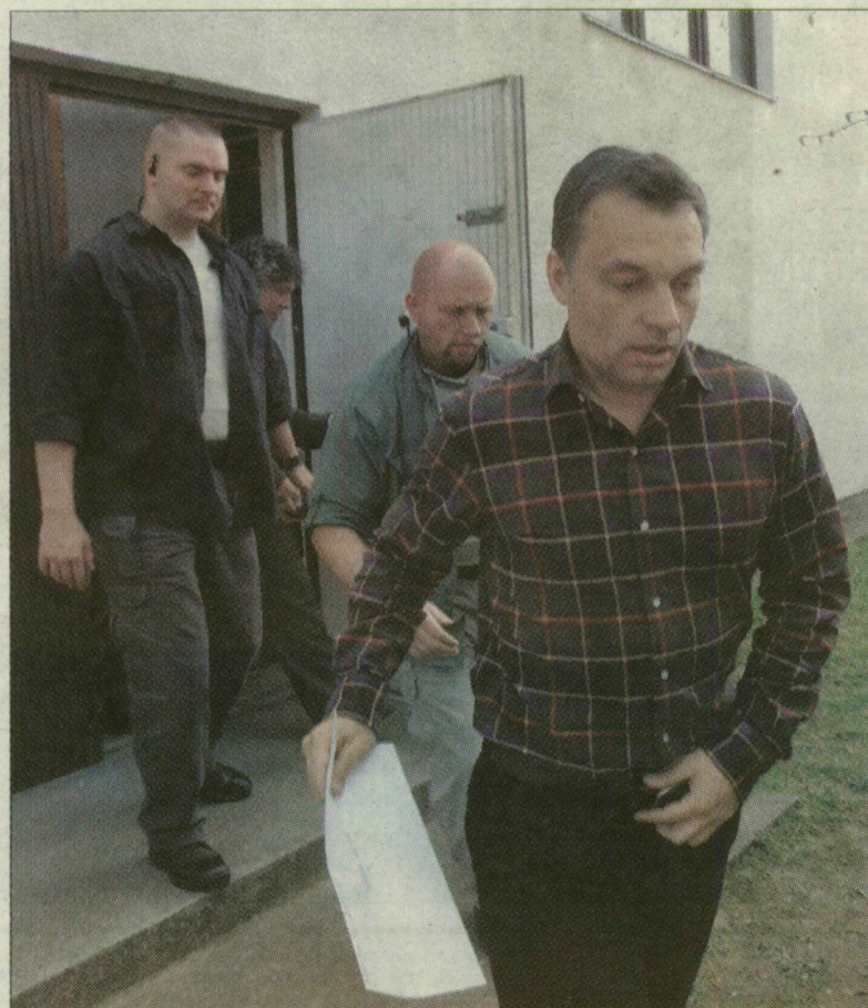
Orbán Viktor távozik az ásotthalmi eligazítást követően

A háromnapos húsvéti szilencium után ismét nagyüzemre váltott a kampánygépezet az országban, így a megyében is. Orbán Viktor , a Fidesz elnöke tegnap Ásotthalmon tartott rendezvényen – ami egyébként a helyi sajtó képviselői számára zárt volt – beszélt aktivistáihoz, a párt támogatóihoz. Arra kérte őket, hogy a győzödjének majd meg arról, hogy a rájuk bízott szavazók voksoltak-e. A Fidesz elnöke lapunknak elmondta: szeretné, ha a vidéki Magyarország is kezébe venné sorsát.