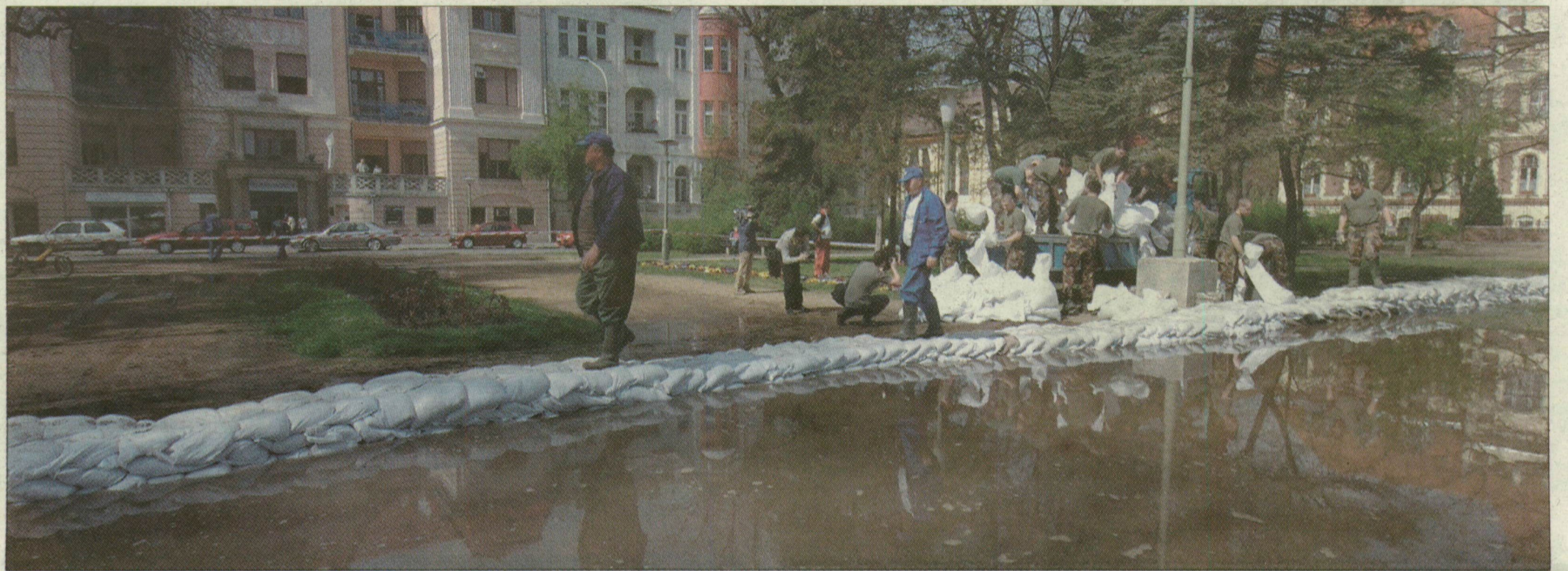
Rendkívüli helyzet a szegedi Sajtóház előtt is. Fakadó víz bukkant elő a folyó gátja és az épület között