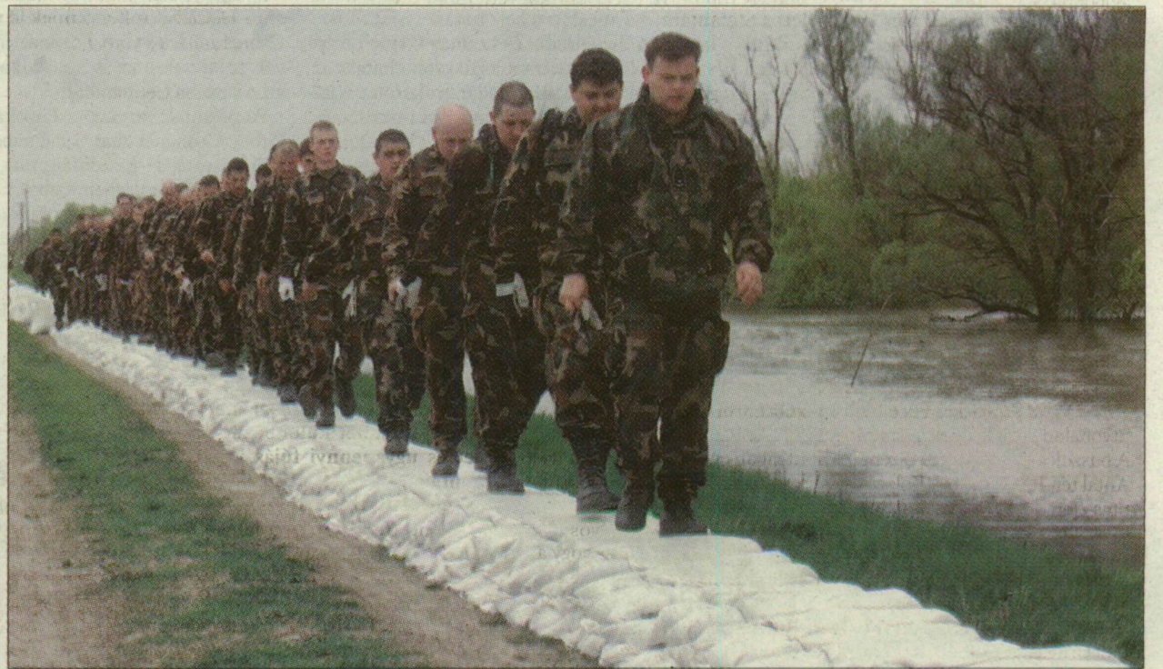
Katonák tömörítik a töltésre vitt homokzsákokat