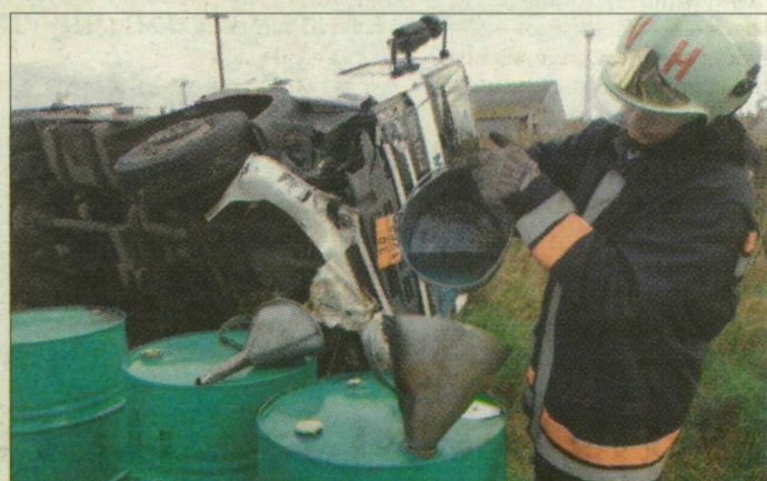
A rakomány szerencsére nem ömlött ki

A személyautó Földeák felé tartott, amikor – látva az előtte közlekedő mezőgazdasági vonatokat – lassított, a mögötte haladó tartálykocsi pedig neki-ütközött. A Ford ezt követően megpördült, és az egyik árokba kötött ki, míg a tartályautó a túloldali árokba hajtott. A baleset körülményeit a vásárhelyi rendőrkapitányság vizsgálja. A tartályautó az ütközés következtében az oldalára borult, a gázolaj azonban nem ömlött ki, át lehetett fejni egy másik tartálykocsiba. A műszaki mentés órákig tartott.