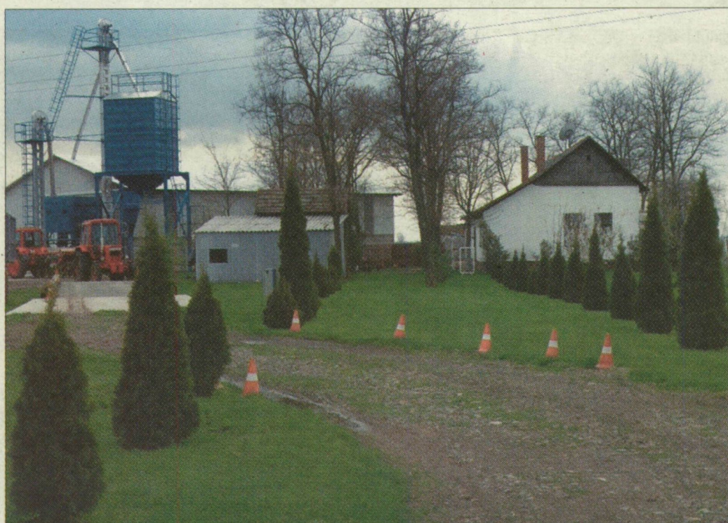
A család ezen a tanyán lakik, gazdálkodásból élnek

A negyvenhat esztendőes asszony fél éve depresszióban szenvedett, kórházi kezelés alatt állt, és öngyilkossági kísérlete is volt korábban – mondta el lapunknak özvegye.