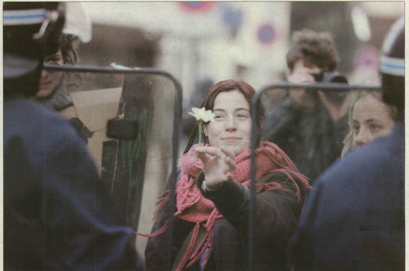
A héten is folytatódott az új foglalkoztatási törvény elleni tüntetések Franciaországban. Egy lány virágot nyújt a rohamrendőrök felé