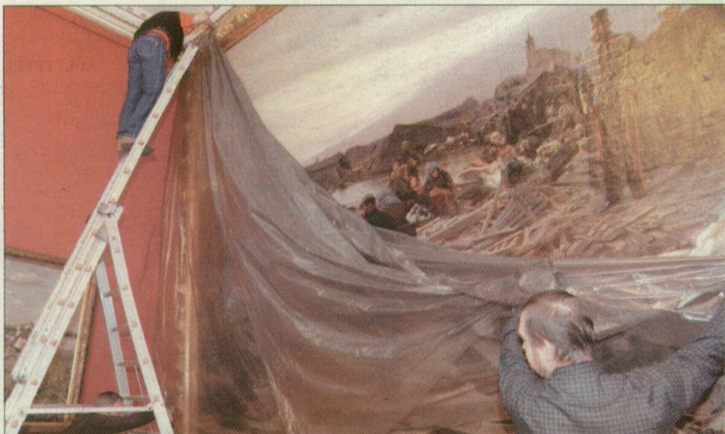
Az árvíz képet elrejtik a Munkácsy-kiállítás idejére