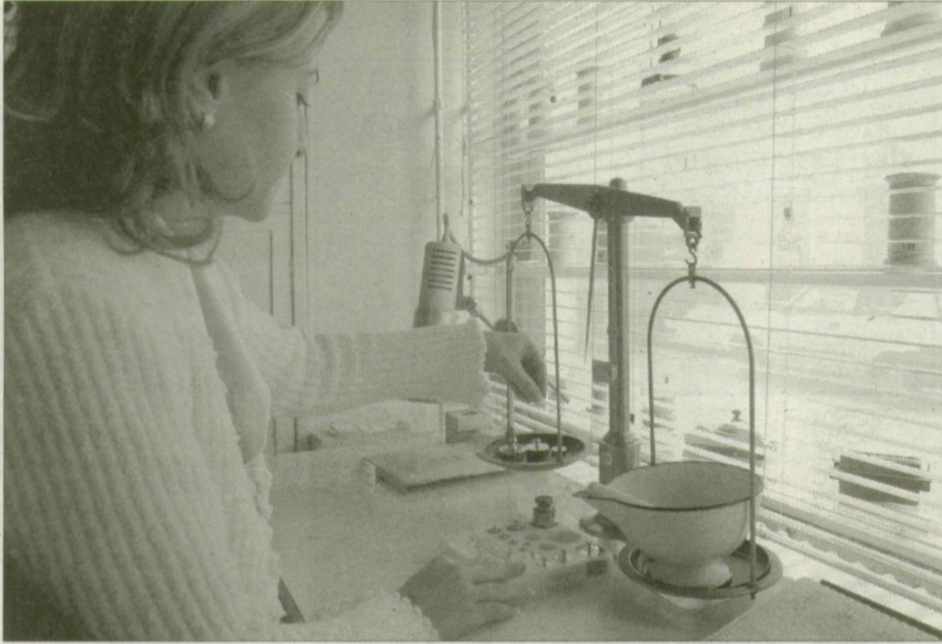
Működik a patikaméreg, sokan várják a gyógyulást a gyógyszerektől ILLUSZTRÁCIÓ: KARNOK CSABA

Szegeden is végeznek emberen gyógyszerkísérleteket. A tesztek a résztvevők tudásával, beleegyezésével, a legmagasabb fokú biztonsági rendszabályok betartásával folynak. A Magyarországon jelenleg folyó kísérletek a kevésbé kockázatos kategóriájába tartoznak, ám várható: a nagy nyugati gyógyszeripar nem sokára azokba a régiókba – jórészt Kelet-, de Közép-Európába is – exportálja a kockázatosabb kísérleteket is, ahol kevesebb pénzbe kerül a biztonság.