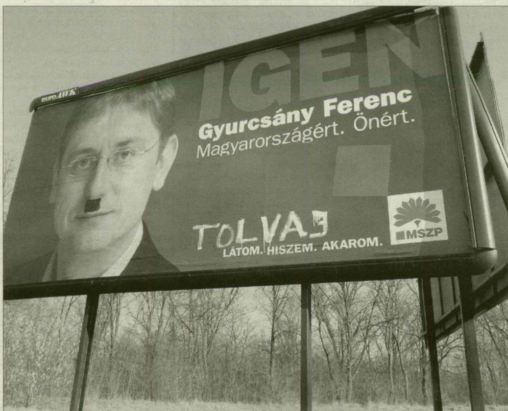
Az MSZP nem tesz feljelentést, a Fidesz elítéli a vandalizmust

Botka László polgármester, az MSZP megyei elnöke megkeresésünkre azt mondta: „Nagyon büszke vagyok arra, hogy egyetlenegy Orbán Viktor és fideszes plakát sincs megrongálva a városban.” A szocialisták vezetője elmondta, hogy a hirdetőményeket két-három nap után leszaggatják, összefirkálják, de a hét vége óta majd minden plakátjukat megrongálták. Arra nem kí-