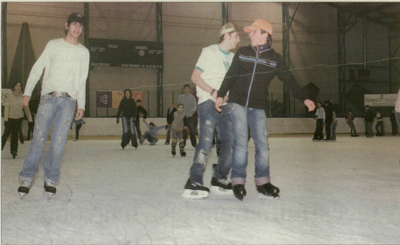
A korcsolyázók még kihasználják a tél utolsó örömeit