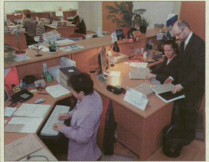
Szegeden, a Széchenyi téri épületben a régi konyhát leíró irodává alakították át