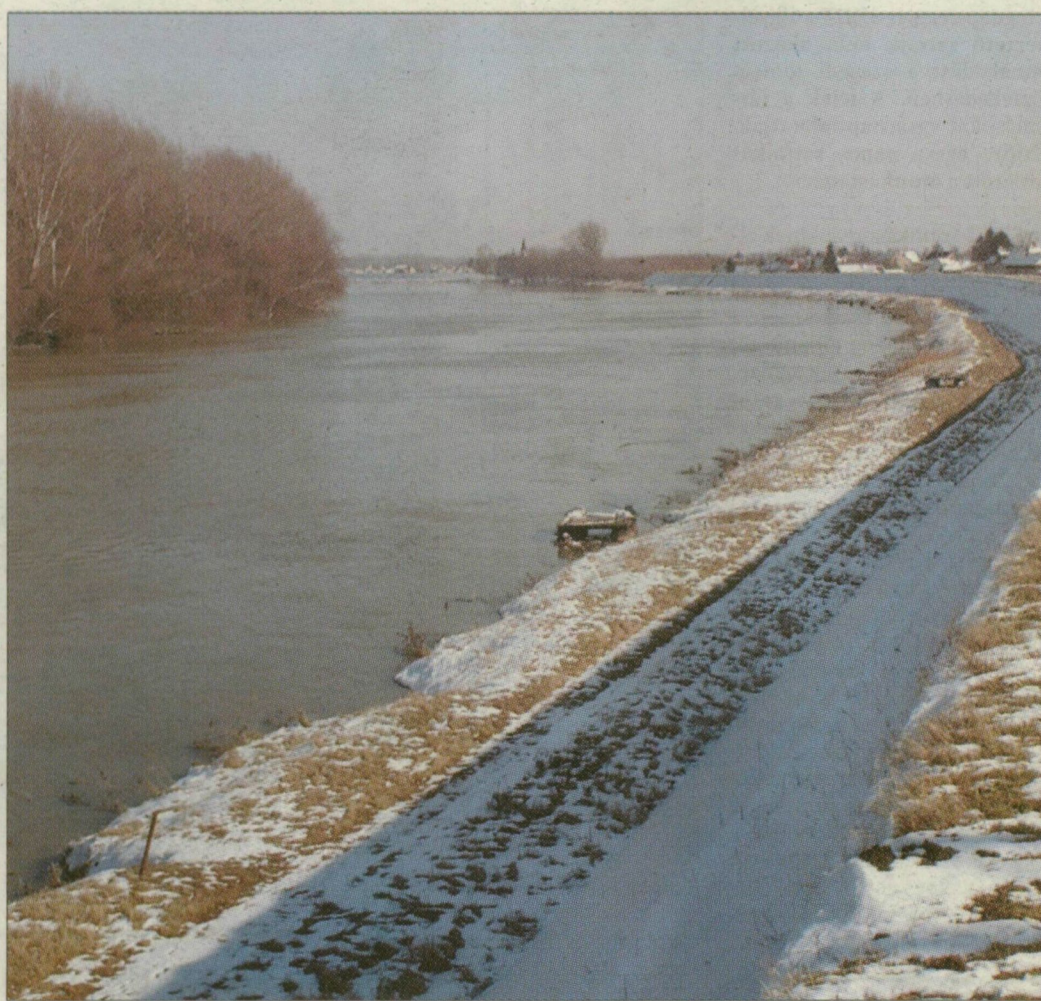
A globális éghajlatváltozással mind szélsőségesebb vízjárású Tisza nélkülözhetetlenné teszi a tározókat

– Remélhetőleg nagyon ritkán kerül majd víz alá a tározó, de időnként nyilván bekövetkezik elárasztás. A száraz időszakok