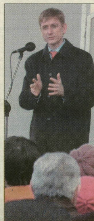
Dávid Ibolya Szegeden, Gyurcsány Ferenc Makón

Az MDF elnöke, Dávid Ibolya, szegedi fórumán vita alakult arról, együtt kell-e működniük a jobboldali pártokkal. Autópálya-építést, termálfürdő-fejlesztést ígért tegnap Makón Gyurcsány Ferenc miniszterelnök.