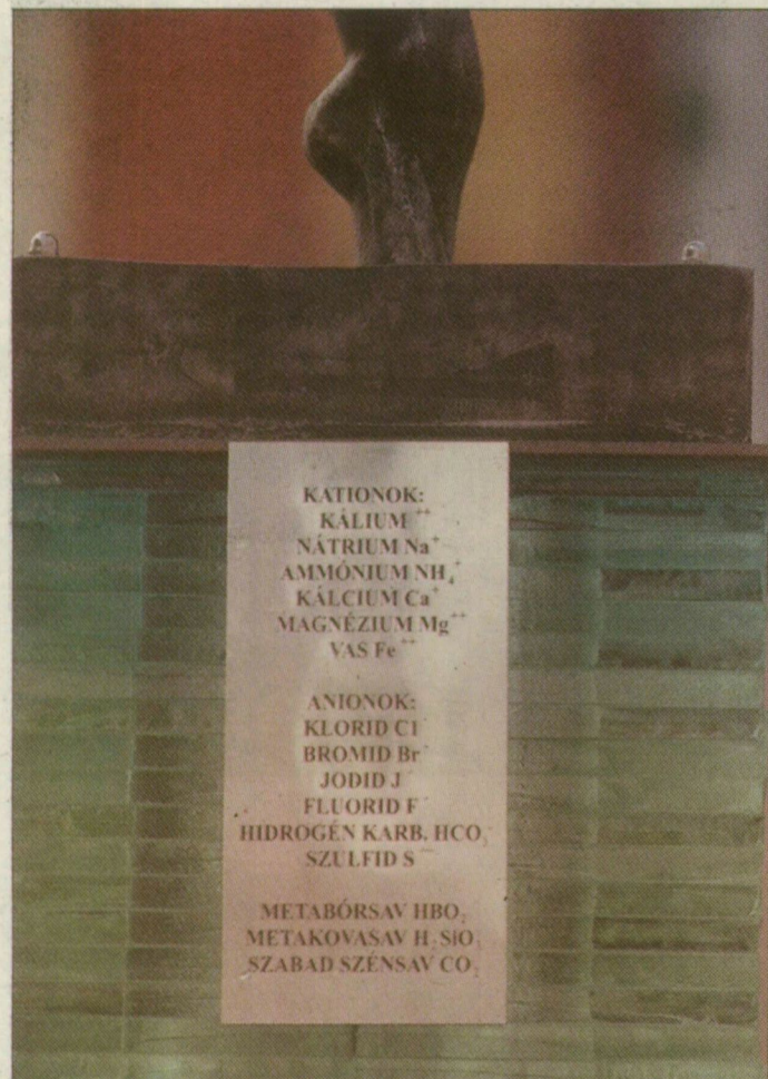
Kálium, kalcium, szulfid – több vagy kevesebb töltés, nem mindegy

Idén januárban fejeződött be az Anna-kút felújítása. A díszes kifolyó oldalán a gyógyvíz összetételéről tábla tájékoztat, a feliratába azonban, sajnos, több hiba csúszott. Az egyetem alkalmazott kémia tanszékének oktatói nézték át a listát: a kálium, a kalcium és a szulfid melletti, töltést jelölő plusz- és mínuszjelek hibásak. Hol több, hol pedig kevesebb szerepel belőlük a vegyjelek mellett, ami a vegyjelek szerint súlyos hiba. Természetes körülmények között ezek az ionok nem fordulhatnak elő. Az önkormányzat városfejlesztési irodája heteken belül új táblát gravírozottat, körülbelül 50 ezer forintba kerül.