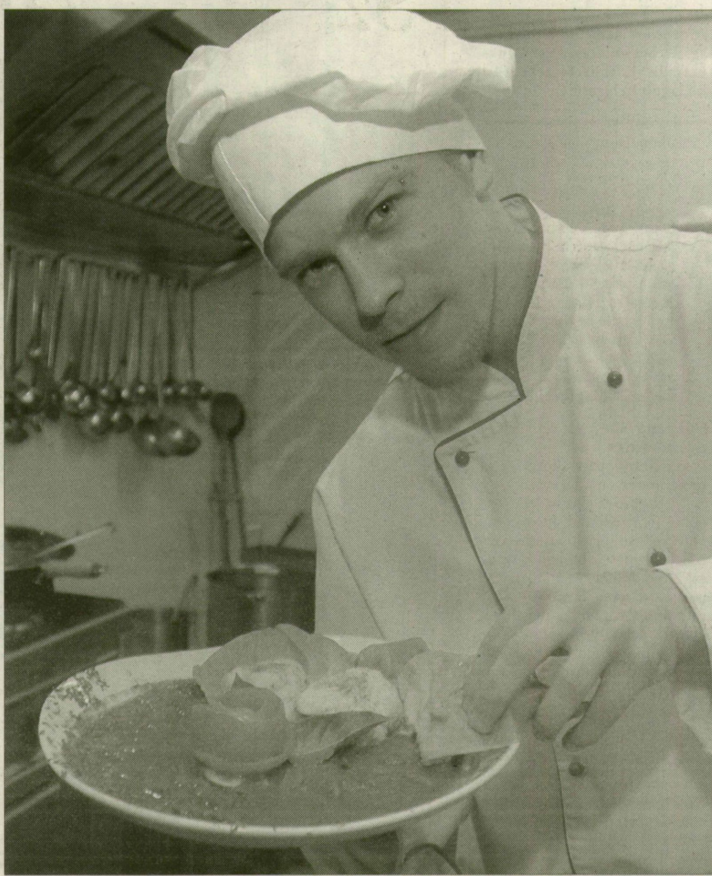
Vadas zsemlegombóccal. A Port Royal étterem igazi magyaros ízekkel várja a vendégeket.

Habár Szegeden csak kilenc vendéglátóhely csatlakozott a nagy ízutazáshoz, a gasztronómia évében gyaníthatóan nem ez lesz az utolsó ilyen jellegű akció. A Góry Pince és Terasz legközelebb mindenképpen szeretne csatlakozni a kampányhoz. Ábel Antal