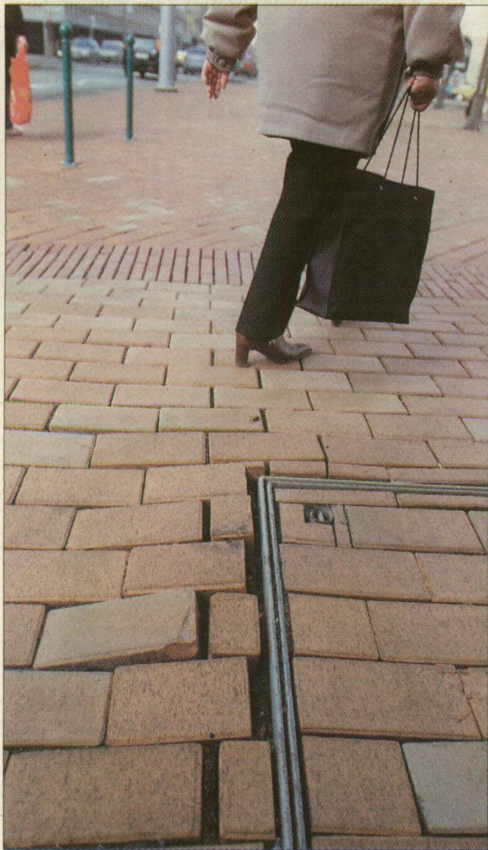
A díszburkolat nem bírja el a teherautókat