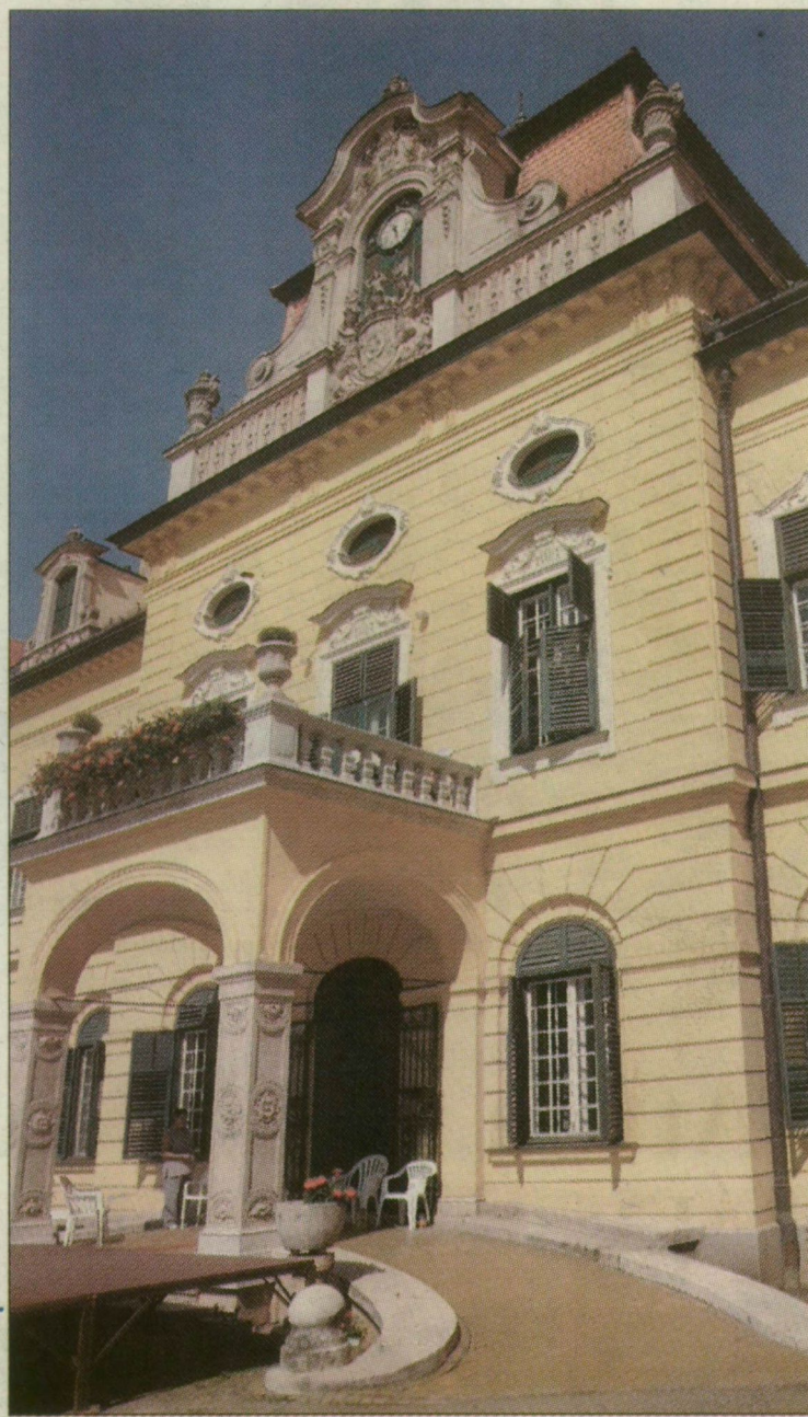
A beruházónak új otthont kell építenie – cserébe megkapja a megye egyik legértékesebb épületét, a kastélyt