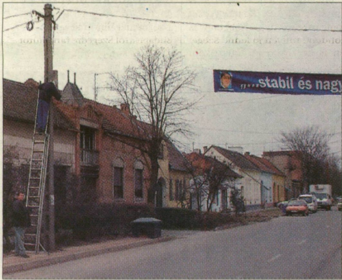
Munka közben fényképezték le a plakátjavítókat

Azt ugyan nem mondta, de valószínű, hogy a fotóknak nem lesz következménye: hiszen molinót javítani nem tilos.