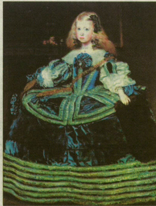
Velázquez Margarita Teresa infánsnő kék ruhában című festménye (Kunsthistorisches Museum, Bécs)

jutni a Szépművészeti Múzeumba. A több mint száz nevezetes alkotást bemutató tárlatot a január 28-i megnyitása óta több mint 25 ezren csodálták meg. A 13 külföldi gyűjteményből és a Szépművészeti Múzeum spanyol kollekciójából válogatott tárlaton El Greco, Velázquez, Goya remekművei mellett többek között Moráles, Mazo, Murillo, Zurbarán, Ribera és Meléndez alkotásai képviselik a spanyol festészetet.