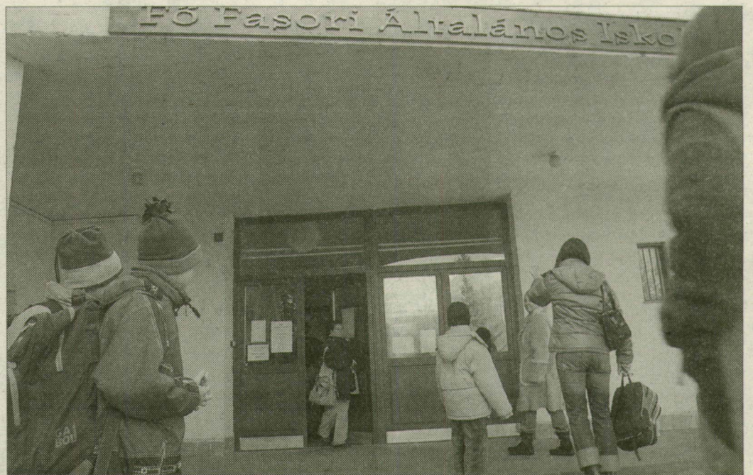
Várakozás az intézmény előtt. Többen felháborodtak az intézkedésen