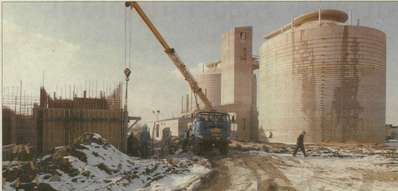
Az épülő szennyvíztisztító mellett jobbra látszik a meglévő tisztítótelep, hátul a két rothasztótorony áll