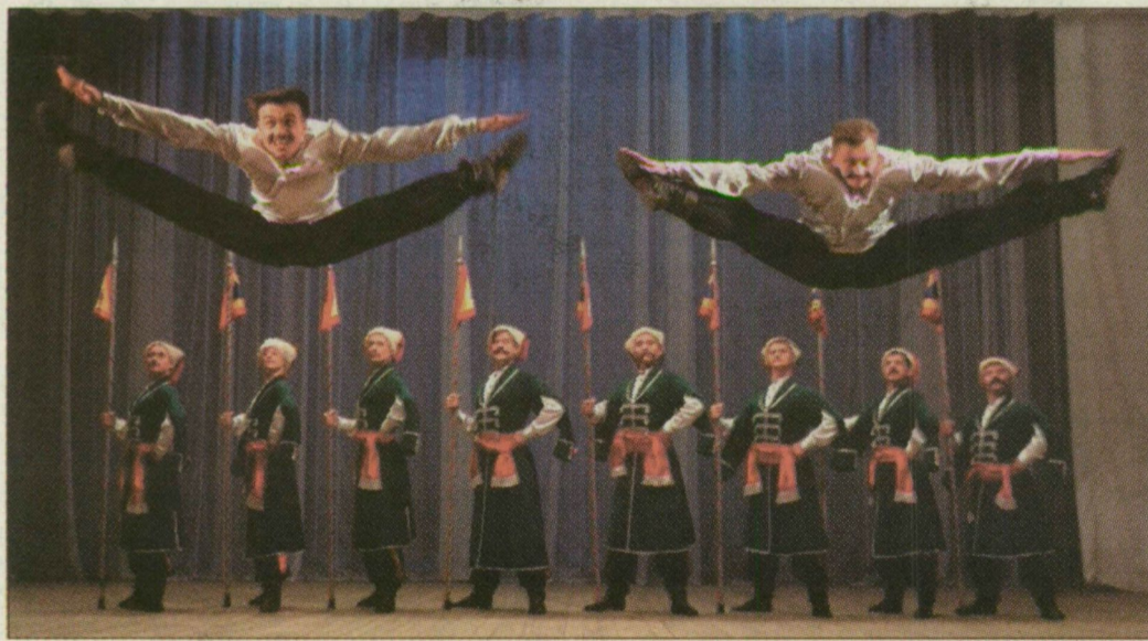
A virtuóz kozák táncokkal világszerte sikert aratott már a doni társulat