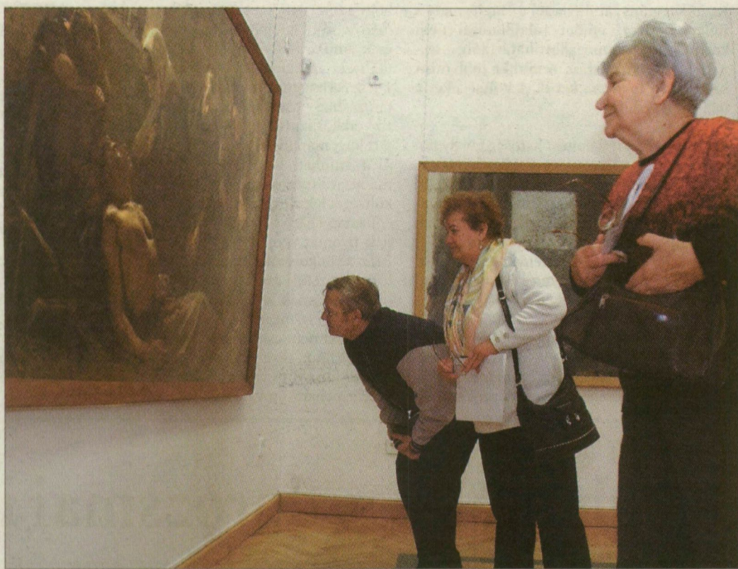
Sokan ellátogatnak a múzeumba, de nincs tömeg

Szerda délelőtt nincs nagy tolongás a kiállítóteremben, ottjártunkkor tizenkét látogatót szá-