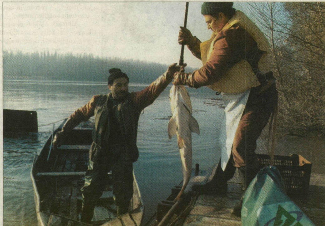
Méretes döglött halat emelnek ki a szennyezett Tiszából 2000 februárjában

■ A Csemete egyesület február 11-én, a tiszai cianidszennyezés szegedi levonulásának 6. évfordulóján 17 órakor a Roosevelti téri Juhász Gyula-szobornál tart megemlékezést.