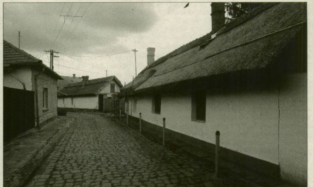
Csongrád óvárosa műemlék jellegű területének valamennyi épülete védett

A magyar nagyvárosok műemléklistája pontosan mutatja, milyen sors jutott az illető