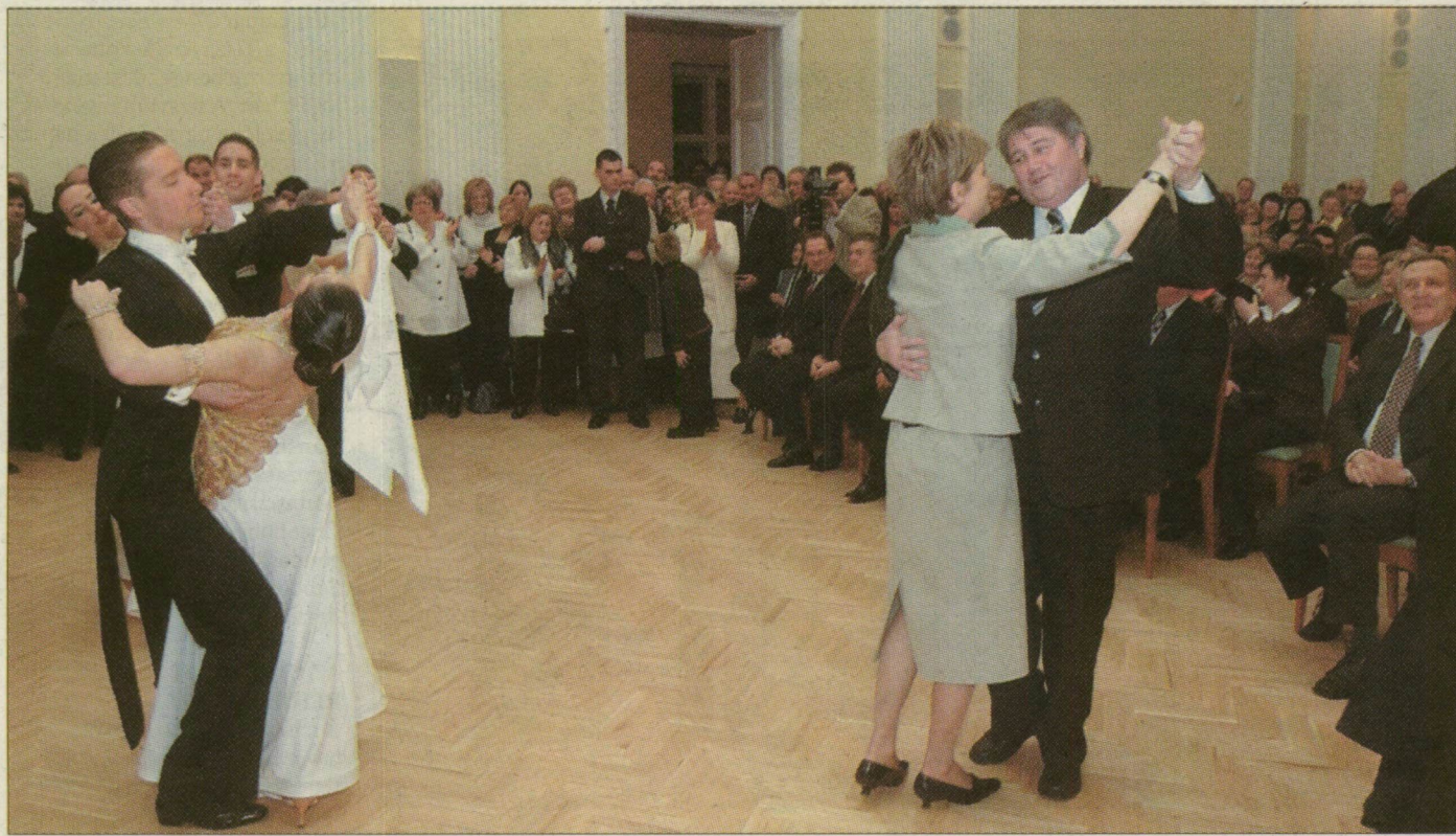
Az Országgyűlés elnöke szerint a szentesi polgármester a táncban is jól vezet