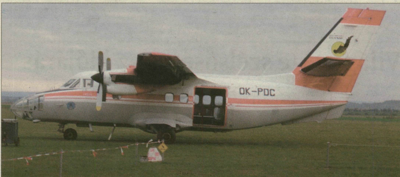
Az L410-es olcsón üzemelő, megbízható, egyszerű kisgép – ilyet telepítene egy légitársaság Szegedre