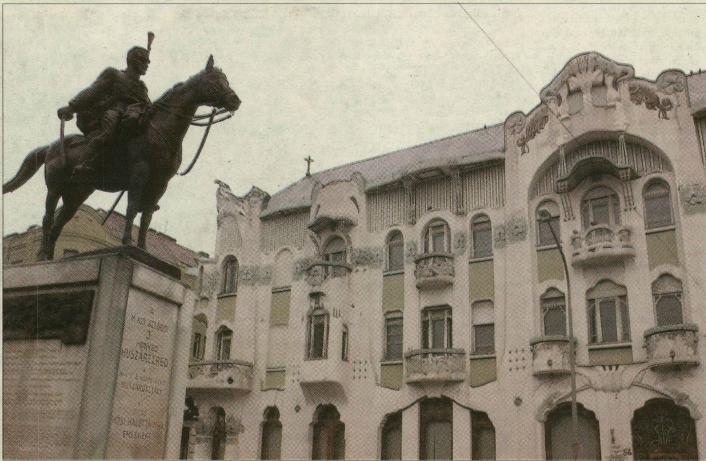
Szeged egyik legszebb épülete az impozáns Tisza Lajos körüti Reök-palota