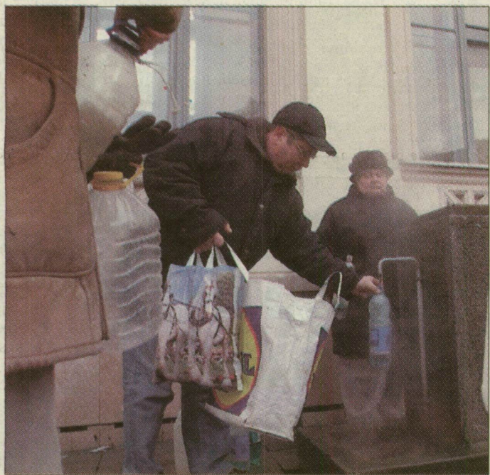
A víz változatlanul kapós