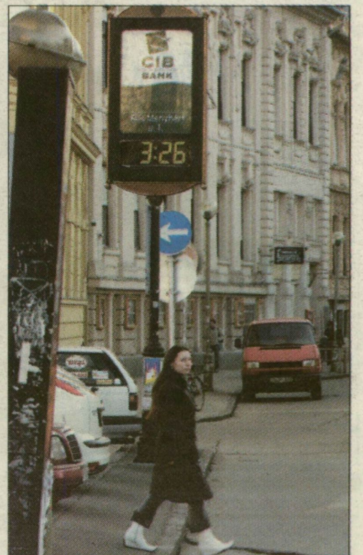
Áll az óra az Árpád téren