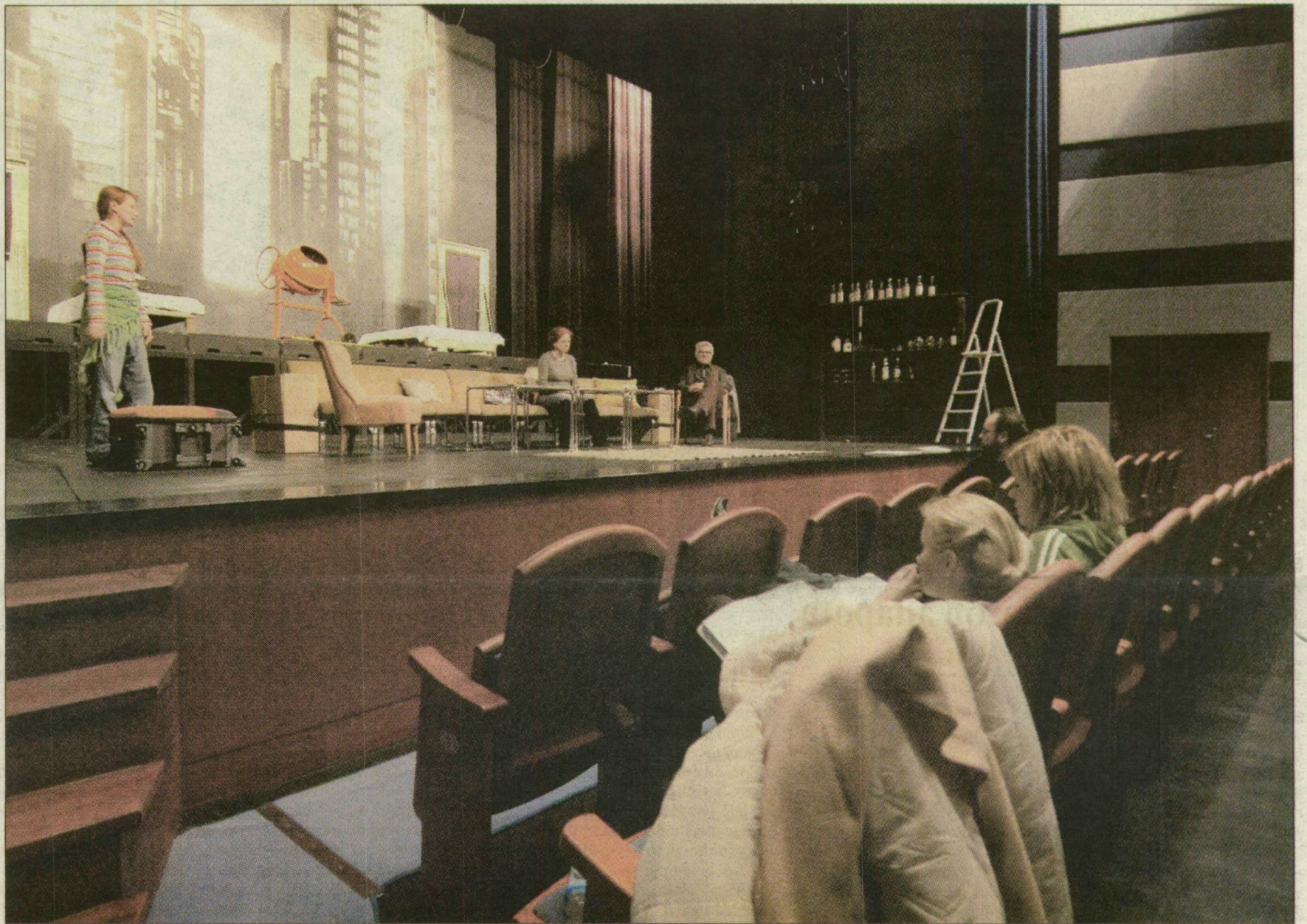
Szemmagasságban van a színpad, innen a lábakat látják leginkább a nézők. A direktor az első két sort bontatná le. Felvételünk a tegnapi próbán készült.

Még nagyobb ellentét feszül a vitázók között a nézőtér első két sora miatt. Székhelyi legszívesebben kivetetné a székeket, és a helyet a mozgássérülteknek biztosítaná. Rantal ezt az ötletet marhaságnak nevezte, és kijelentette: nem engedi meg. Szerinte ha a sülyeszethető zenekari árkot nem csatolnák előszínpadként a színpadhoz, akkor jól lehetne látni az első sorokból is. A tervező azt hangsúlyozza, nincsenek tervezési hiányosságok. Ugyanakkor a két hatfős oldalerkélyből sem látni semmit.