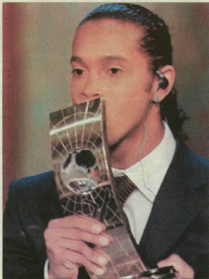
Ronaldinho megcsókolja a kitüntetést

Ronaldinho a Gremióban kezdte pályafutását, ahol 1998-ban, azaz 18 évesen játszott először profik között. Egy év múlva már a közönség első számú kedvence volt. 2001-ben járt le hazai szerződése, s nyilvánvaló volt számára, hogy Európában folytatja. Elsőként a francia Paris St. Germain csapatát le az ifjú titánra, 2001. január 17-én ötéves szerződést kötött a francia klubbal. A földkerekség elsősorban a 2002-es világbajnokságon figyelt fel rá, amelyen az aranyérmes brazil válogatott egyik legjobbjá volt. 2003 nyarán elköltözött Párizsból, és számos